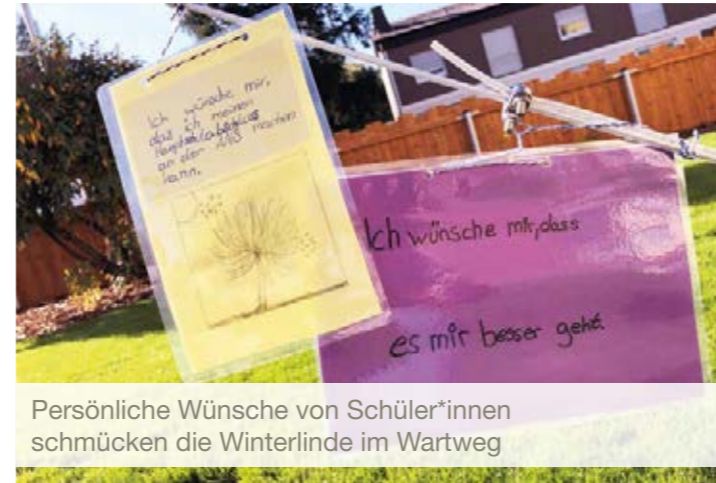
Persönliche Wünsche von Schüler*innen schmücken die Winterlinde im Wartweg

Bunt gestaltete »Jubiläums-Leitpfosten« der Agnes-Neuhaus-Schule