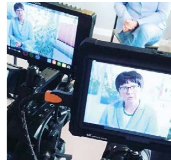
Persönliche Geschichten von Menschen aus dem SkF e. V. Gießen gibt es hier zu sehen: https://vimeo.com/user125778610

Per Video miteinander zu sprechen hilft, wenn man sich nicht besuchen kann. Diese Möglichkeit haben wir auch dazu genutzt, um im Jubiläumsjahr Geschichten aus dem SkF e. V. Gießen zu sammeln und in die Öffentlichkeit zu tragen. Zu sehen gibt es Video-Stories von Mitarbeiter*innen aus unterschiedlichen Einrichtungen, in denen sie die Fragen beantworten: »Welche persönliche Geschichte verbindest du mit dem SkF? Wann bist du dieses Jahr mutig neue Wege gegangen? Wo wird der SkF in Zukunft gebraucht?« Außerdem sind mehrere Interview-Portraits von Menschen und Einrichtungen des SkF entstanden. Die Sammlung wächst und ist im Internet auf Vimeo zu finden: https://vimeo.com/user125778610