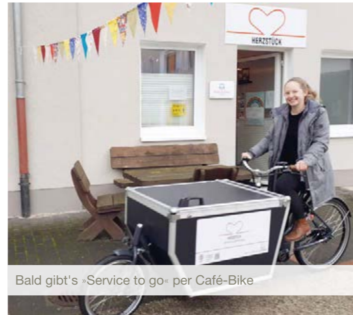
Bald gibt's »Service to go« per Café-Bike