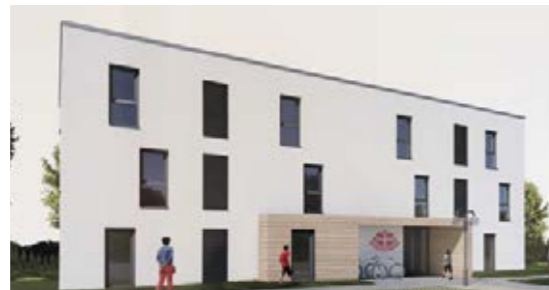
Entwürfe für die neue Eltern-Kind-Einrichtung in der Adolph-Kolping-Straße von HR Bau, Heinstadt & Reiss GmbH