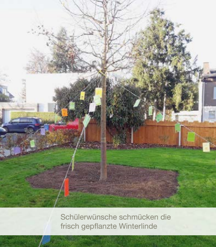
Schülerwünsche schmücken die frisch gepflanzte Winterlinde

Im Jahr 2018 haben wir die Trägerschaft der Kindertagesstätte und des Familienzentrums St. Thomas Morus übernommen. Seit Sommer 2020 entsteht in der Mittermeier Straße eine neue Kindertagesstätte für 60 Kinder, denn es ist uns mit Unterstützung der Stadt Gießen im Berichtsjahr gelungen, einen verlässlichen Partner für das Investorenvorhaben zu finden. Das Gebäude wird Mitte 2022 bezugsfertig sein.