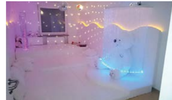
Der Snoezelraum im Frauenhaus ist ein Rückzugsort, an dem Frauen und Kinder zur Ruhe kommen können.

Mehr therapeutische Angebote für Frauen und Kinder anzubieten und ehrenamtliche Helfer*innen zu gewinnen steht ganz oben auf der Agenda des Teams vom Frauenhaus. Des Weiteren plant die Interventionsstelle gegen häusliche Gewalt (IST), sich stärker um Gewaltprävention zu kümmern, auch bei Kindern.