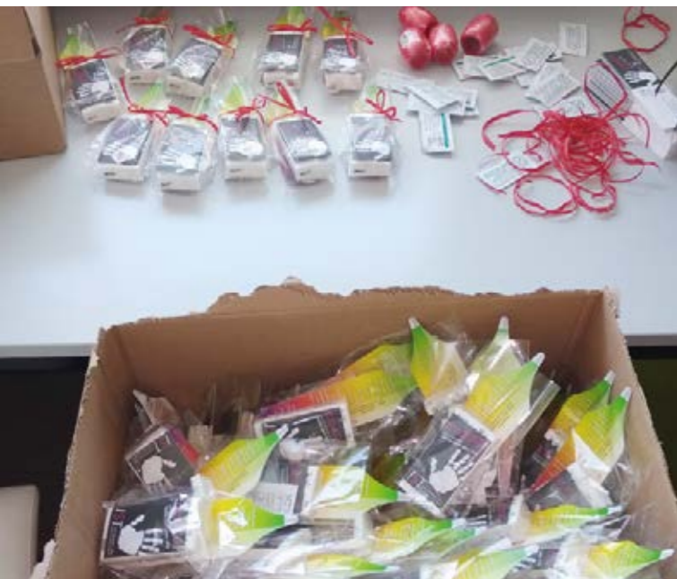
Hilfe zum Mitnehmen: 500 Wegweiser-Tütchen für Frauen verteilt der SkF zum internationalen Tag gegen Gewalt gegen Frauen am 25. November

An die Wurzeln des SkF in Zeiten der Gründung 1920 erinnern und zeigen, dass unsere Anliegen heute noch wichtig sind – das war der Plan für das 100-jährige Jubiläum des SkF e. V. Gießen. Manches hat die Corona-Pandemie verhindert, beispielsweise den Festakt mit vielen Ehrengästen und die Feier für die Mitarbeiter*innen. Anderes hat sie befördert: Den Impuls, gerade in schwierigen Zeiten für die Klient*innen da zu sein und sie zu unterstützen. Das ist gelungen, auch dank neuer digitaler Möglichkeiten.