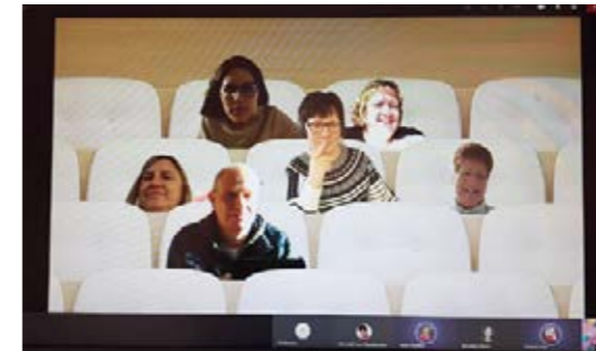
Mit Humor geht vieles leichter...

Corona hat gezeigt, wie wichtig es ist, sich digital gut aufzustellen. Der SkF e.V. Gießen hat bereits auf das IT-System Microsoft 365 umgestellt, das Lösungen für mobiles Arbeiten und digitale Zusammenarbeit im Paket hat. Videokonferenzen und Teambesprechungen laufen über Microsoft Teams. Das Programm »forms« wird für Befragungen und »sway« für den internen Newsletter genutzt.