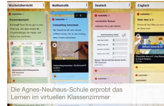
Die Agnes-Neuhaus-Schule erprobt das Lernen im virtuellen Klassenzimmer

Unter dem Jubiläumsmotto »Mutig neue Wege gehen« mussten die Kolleginnen und Kollegen in diesem Jahr mit den Schülern und Eltern tatsächlich ganz neue Wege gehen. Aufgrund der Corona-Pandemie wurde die Digitalisierung innerhalb der Schule sprunghaft vorangetrieben. Die Lehrkräfte mussten ihre Schüler*innen online oder telefonisch unterrichten, eine Kollegin erstellte gar eine interaktive Klassenhomepage. Über ein Sofortprogramm von Bund und Land konnten im Herbst mehrere Tablet-Computer angeschafft werden. Das war ein Lichtblick in dieser für alle schwierigen Zeit, in der die Schüler*innen zu Hause unterrichtet werden mussten. Die Geräte sind bei der Schülerschaft äußerst beliebt.