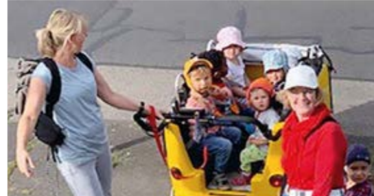
Ein wenig Normalität im Corona-Sommer: Kita St. Hildegard von Bingen beim Ausflug mit dem E-Bollerwagen

»Die Corona-Pandemie hat gezeigt: Stark sind wir nur, wenn wir gemeinsam agieren und Mut haben, Neues zu wagen.«